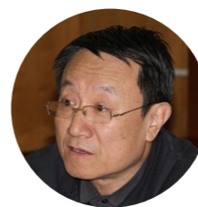
北京理工大学党委书记张炜

北京理工大学党委书记张炜在会上致辞。他肯定了《学位与研究生教育》的办刊成绩,指出《学位与研究生教育》创刊三十年来,凭借准确的期刊定位、清晰的办刊思路和一流的办刊质量,为繁荣我国的学位与研究生教育研究、推进我国研究生教育发展做出了重要的贡献。张炜书记表示,教育部1984年将《学位与研究生教育》托付给北京理工大学承办,是对北京理工大学的信任,《学位与研究生教育》办得好,是北京理工大学的荣耀。因此北京理工大学领导高度重视《学位与研究生教育》的办刊工作,派学术声望高的学校领导担任期刊主编,抽调精兵强将作为编辑部工作人员,并在办公场所、办公经费等方面给予了大力支持。北京理工大学今后会给予学位与研究生教育杂志社更多的支持,让大家把更多的精力放在提高期刊质量上来,把期刊办得更好。